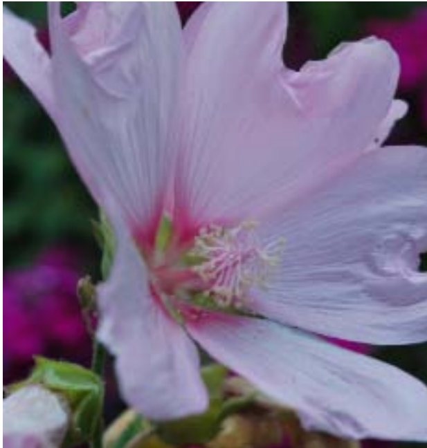
Een mooie zachtroze bloem van Lavatera 'Barnsley'.