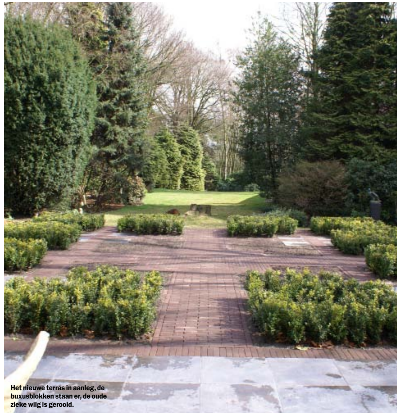
Het nieuwe terras in aanleg, de buxusblokken staan er, de oude zieke wilg is geroid.