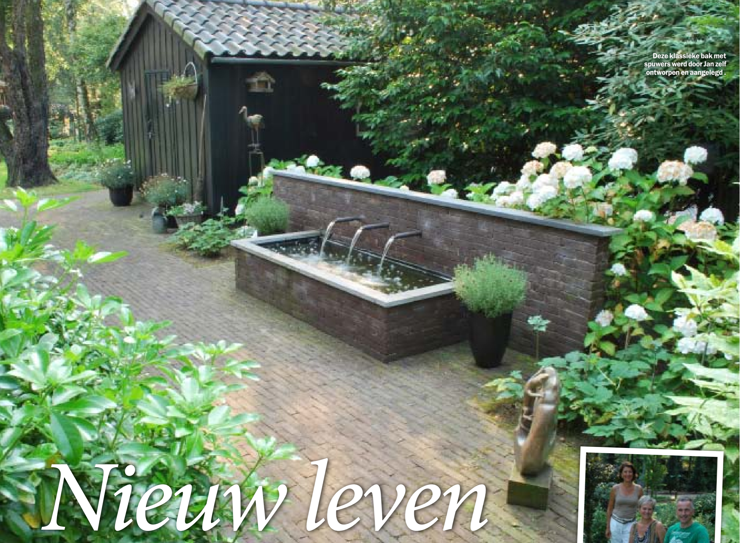
Deze klassieke bak met spuw-ers werd door Jan zelf ontworpen en aangelegd.