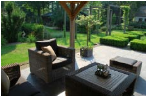
Zicht op de tuin vanuit het loungegedeelte.