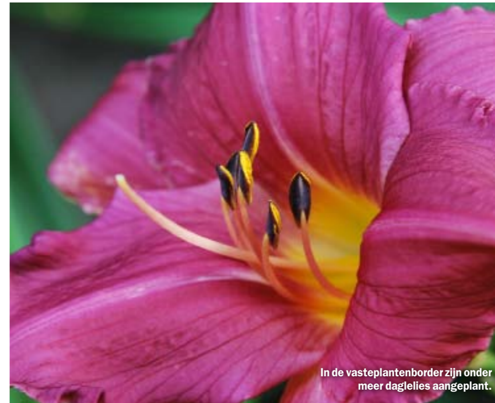
In de vasteplantenborder zijn onder meer daglelies aangeplant.