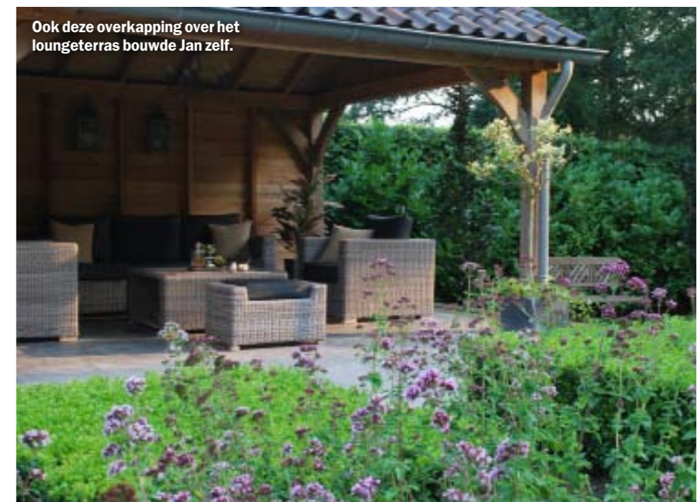
Ook deze overkapping over het lounge-terras bouwde Jan zelf.