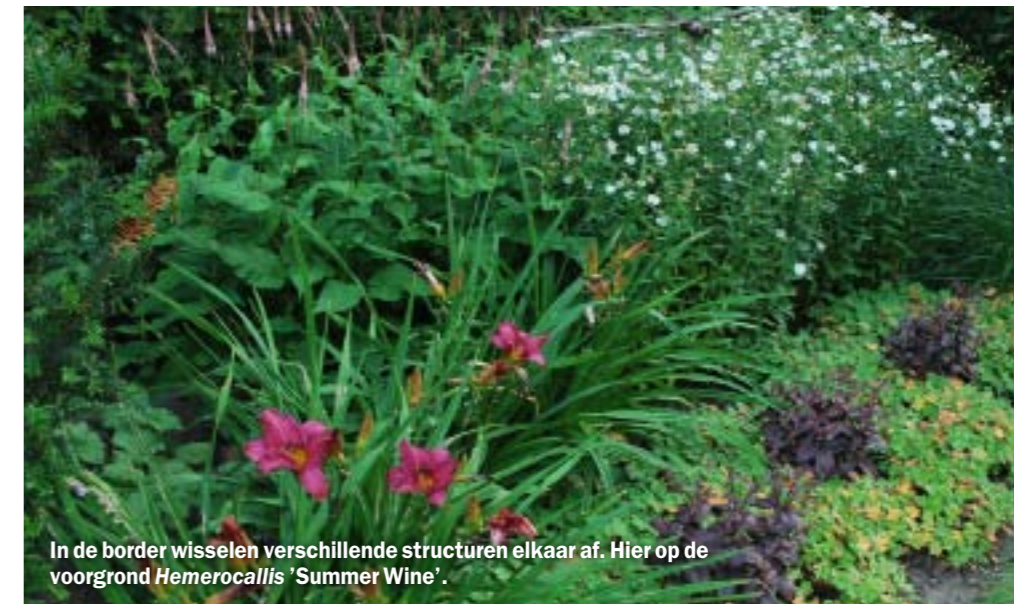
In de border wisselen verschillende structuren elkaar af. Hier op de voorgrond Hemerocallis 'Summer Wine'.