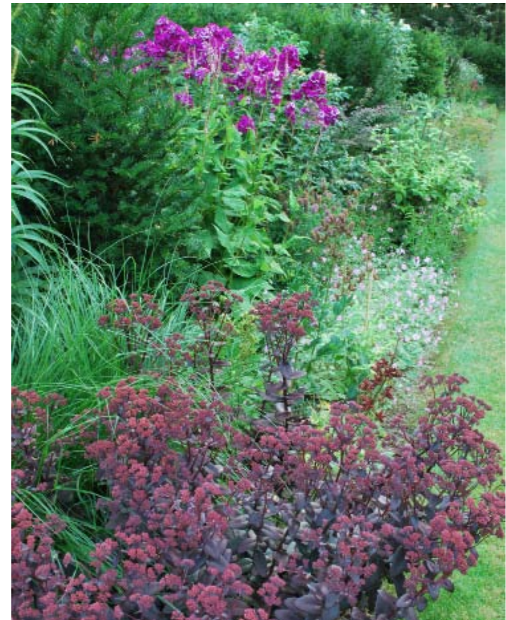
In de weelderige vasteplantenborder overheersen de tinten roze en paars.