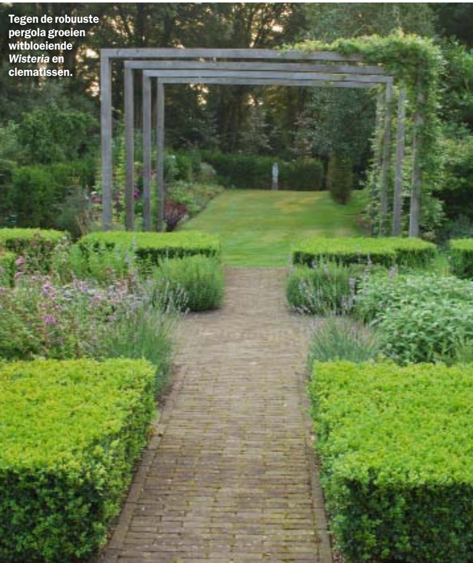
Tegen de robuuste pergola groeien witbloeiende Wisteria en clematissen.